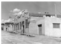
Fàbrica Punt Cal. Nau industrial, a l'avinguda de Joan Maragall. Autor: Quins (Josep Fortea), 09/03/1958. Arxiu Històric Municipal, 1122. Al fons la Fàbrica del Vidre i el molí de vent. Era propietat d'Aguatí Usón Salas.