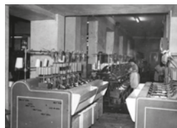
Fàbrica tèxtil Maristany, màquina per fer canilles, Autor desconegut, 17/09/1965. Arxiu Històric Municipal - Donació Francesc Duran Pons, 15252. Les canilles eren peces de fusta contruïda i s'hi hi col·locaven les qualitat i s'embotien la trama que es passava des la llançadora.