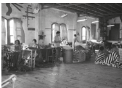
Fàbrica tèxtil Maristany, sala de confecció, 1970-1979. Aquesta sala, situada al pis superior, s'anomenava La Velera perquè antigament s'hi feien les veles.