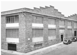
Exterior de la fàbrica DOGI. 1967.