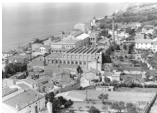
Vista aèria del poble, en què destaca la fàbrica de Can Xala. 1960-1969.

Les treballadores recorden com n'era de gran el recinte, que tenia diversos edificis. S'hi podia entrar pel carrer de Lluís Millet i donava també al carrer de Pau Estapé Maristany, on hi havia el moll de càrrega i descàrrega, però l'entrada principal era a la mateixa carretera nacional i s'hi accedia per unes escales. Un cop a dalt, hi havia les cases dels porters i s'arribava a un gran pati. A mà dreta, recorden la indústria estampadora, que va ser una indústria independent al tancament de la fàbrica fins a finals dels anys noranta.