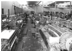
Interior de Cal Soberano, sala de telers, Autor desconegut, 17/09/1965. Arxiu Històric Municipal, 299. Interior de la fàbrica tèxtil. En primer terme, les màquines.

En aquesta fàbrica es feia tot el procés de producció. Algunes treballadores recorden "com hi arribaven el cànem i el cotó, es tenien a la part de química de l'empresa, es posaven en una troca, s'ordien (una feina més ben remunerada), es posaven als pegadores i es preparaven per passar a les pintes i aprest. Finalment, es passava als telers, a les llançadores i es nuava la lona".