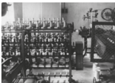
Interior de la fàbrica de Les Tovalloles.