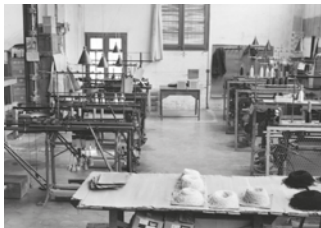
Taller de la fàbrica Sedalines El Pino. Autora: Teresa Torres i Canals. Arxiu Històric Municipal, 12962. Any cinquanta.