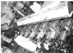
Màquina tèxtil a les Sedalines El Pino. Autor desconegut. 13/02/1959. Arxiu Històric Municipal, 2063. Màquina tèxtil en la qual treballa una noia a l'interior de la fàbrica.