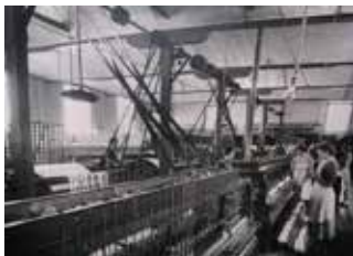
Interior de Can Xala: màquines i treballadores.