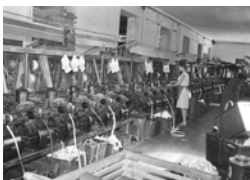
Interior de la fàbrica Cal Soberano, Autor desconegut, 1970-1979. Arxiu Històric Municipal, 10126. Interior, fabricació de cotons.