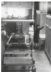
Interior de la fàbrica de Les Tovalloles.

La gent encara recorda que al mateix taller s'hi podien comprar al detall tovalloles (d'aquí el nom), draps de cuina, etc.