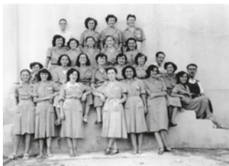
Treballadores de la fàbrica de Ca n'Humet.

Les dones recorden que s'hi feien troques de llana, concretament d'una marca llavors molt reconeguda anomenada La Esmeralda. A la fàbrica no s'hi feia roba, sinó només cabdells.