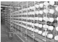
Interior de la fàbrica Cal Soberano, Bobines connectades a l'ordidor.