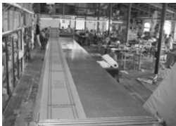
Fàbrica tèxtil Maristany, sala de desfilades, Aquesta sala, situada al pis superior, s'anomenava La Velera perquè antigament s'hi feien les veles.