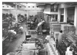
Fàbrica tèxtil Maristany, sala de telers, Autor desconegut, 17/09/1965. Arxiu Històric Municipal - Donació de Francesc Duran Pons, 15248. Penances Elant.