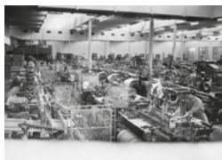
Fàbrica tèxtil Maristany, sala de telers, Autor desconegut, 17/09/1965. Arxiu Històric Municipal - Donació de Francesc Duran Pons, 15237. Aprest del teixit per donar-li consistència.