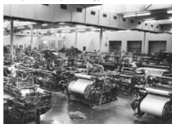
Fàbrica tèxtil Maristany, sala de telers, Autor desconegut, 17/09/1965. Arxiu Històric Municipal - Donació de Francesc Duran Pons, 15247.