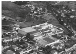
Fotografia aèria de Cal Soberano, Autor desconegut, 15/01/1966. Arxiu Històric Municipal, 14814. Fotografia aèria de la fàbrica. S'hi veu Can Jordana i els horitzos de Can Piles d'Estada.