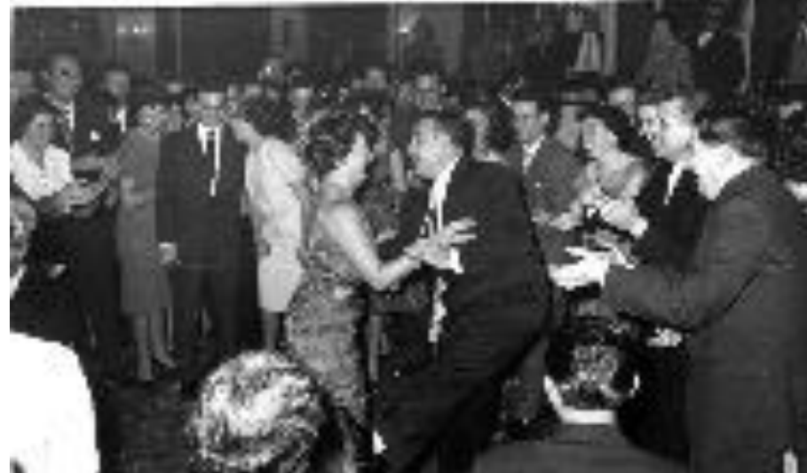
Arxiu Municipal del Masnou, fotografia núm. 1217