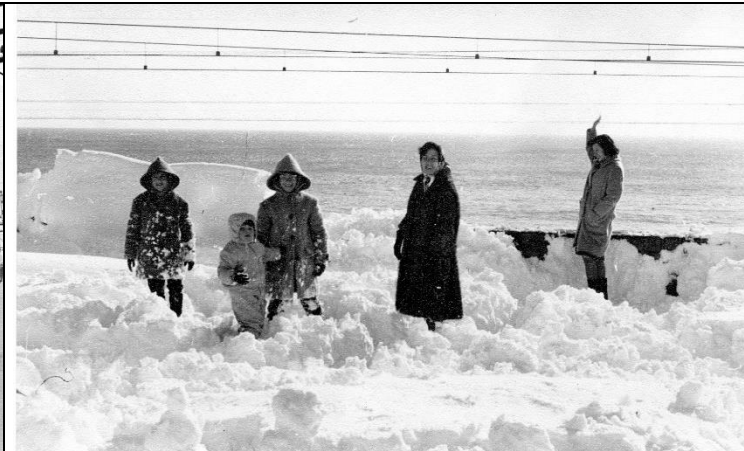
Arxiu Municipal del Masnou, fotografia núm. 139