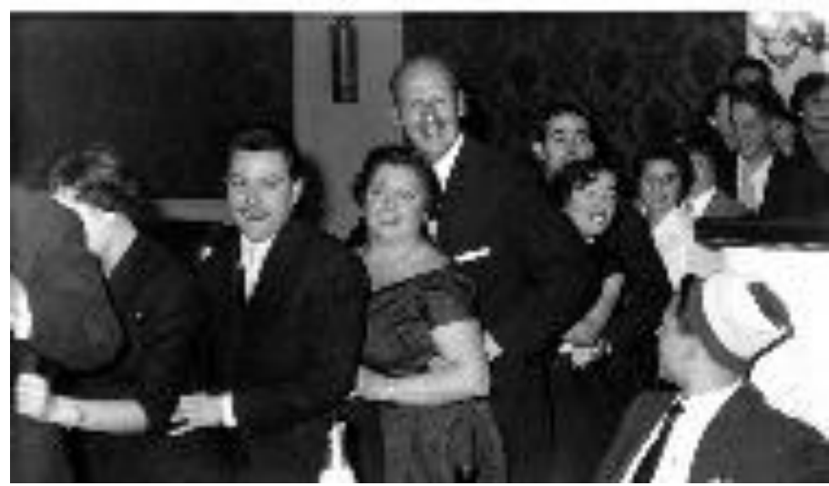
Arxiu Municipal del Masnou, fotografia núm. 1205