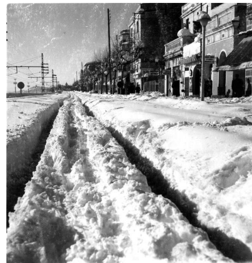
Arxiu Municipal del Masnou, fotografia núm. 13152