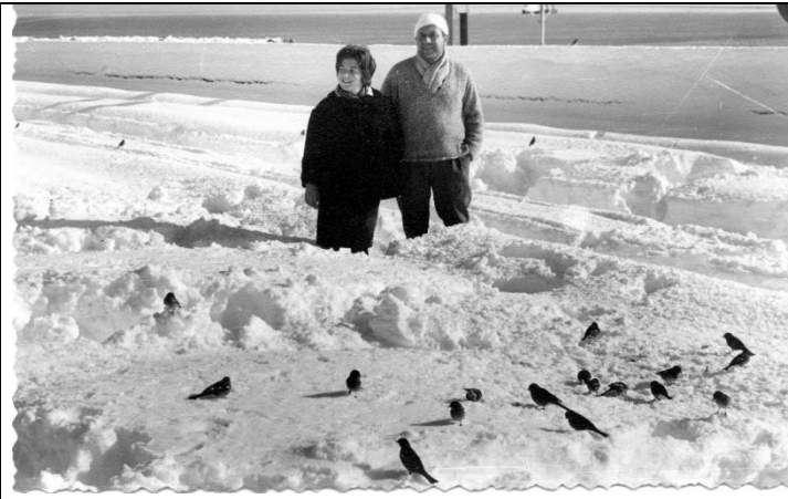
Arxiu Municipal del Masnou, fotografia núm. 1569