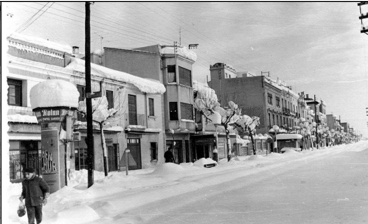
Arxiu Municipal del Masnou, fotografia núm. 145