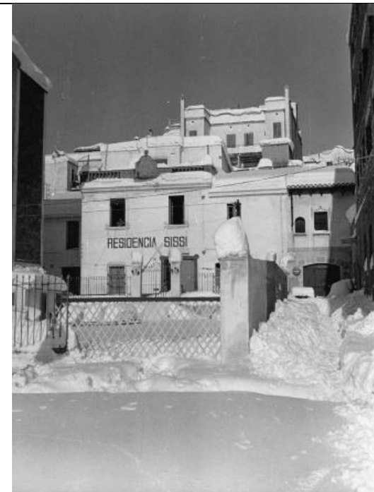
fotografia núm. 941