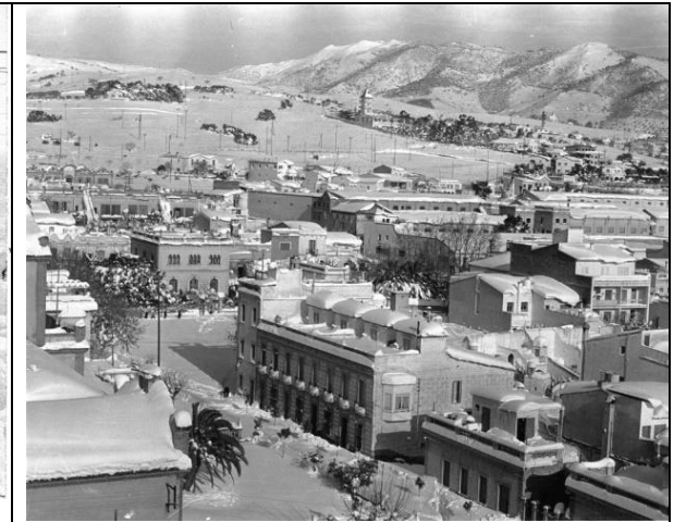
Arxiu Municipal del Masnou, fotografia núm. 951